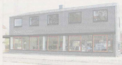
Røllighedsvej i Risskov. Ældre forretnings-ejendom i helt ny forklædning. Bygherre: KTN Holding Aps. Arkitekt: Gudnitz Arkitektfirma.