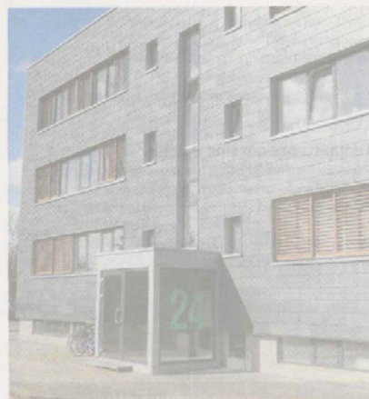
Langkærparken i ny klima-forklædning. Bygherre: AL2Boliq. Arkitekt: Nova5 Arkitekter.