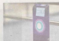
Uanset hvor hårdt man forsøgte at scanne sit Rejsekort fredag morgen, så ville skidtet bare ikke.

»De skal sikre, at der er nogle procedurer, der er bedre end dem, vi så fredag morgen - sådan at der bliver meldt ud hurtigere og klarere. Min holdning er, at når der sker nedbrud på det landsdækkende system, så er