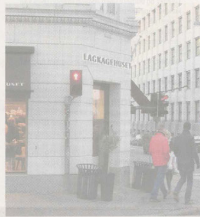
En vellykket ny butiksfacade, hvor Det Hvide Hus er blevet til Lagkagehuset. Bygherre: Ejendomsselskabet SC Aps. Arkitekt: Space Architects and Design Art.