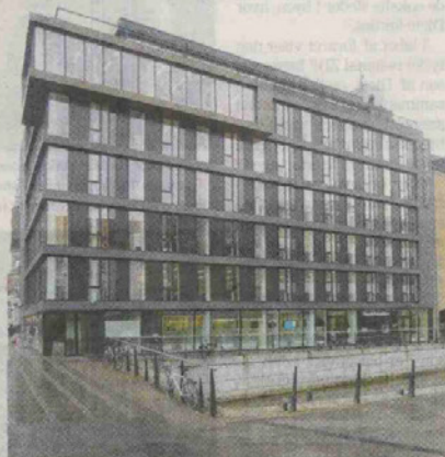
Åboulevarden 11. 1960'ers-byggeriet har fået et helt nyt og moderne udtryk. Bygherre: Åboulevarden Aps. Arkitekt: Arkitema Architects.