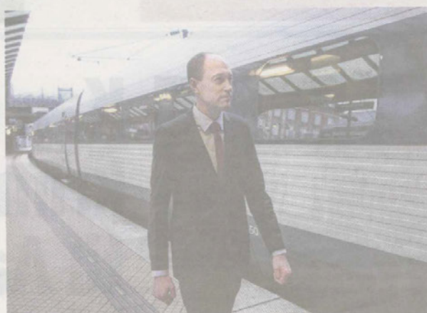
Landets nye transportminister, Magnus Heunicke (S), tog selv toget på arbejde fredag morgen. Han oplevede dermed forvirringen på egen hånd, og kritiserer trafikskaberne for at skabe forvirring og give for lidt information.