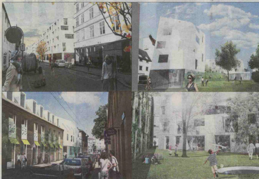
Byggeriet får stier og grønne områder i området mellem Studsgade, Borggade og Paradisgade