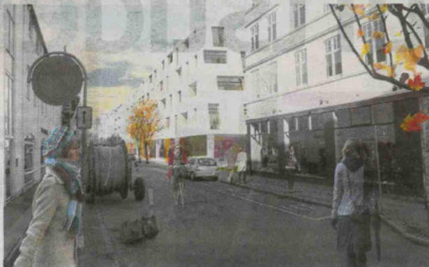
Det nye byggeri får blandt andet facade ud mod Borggade, som visualiseringen her viser. Illustration: Cubo Arkitekter.

Borggade udfyldes i stedet med en ny bygning, som bugter sig igennem gården til Paradisgade. Der bliver desuden en offentlig sti gennem bebyggelsen, der forbinder Borggade