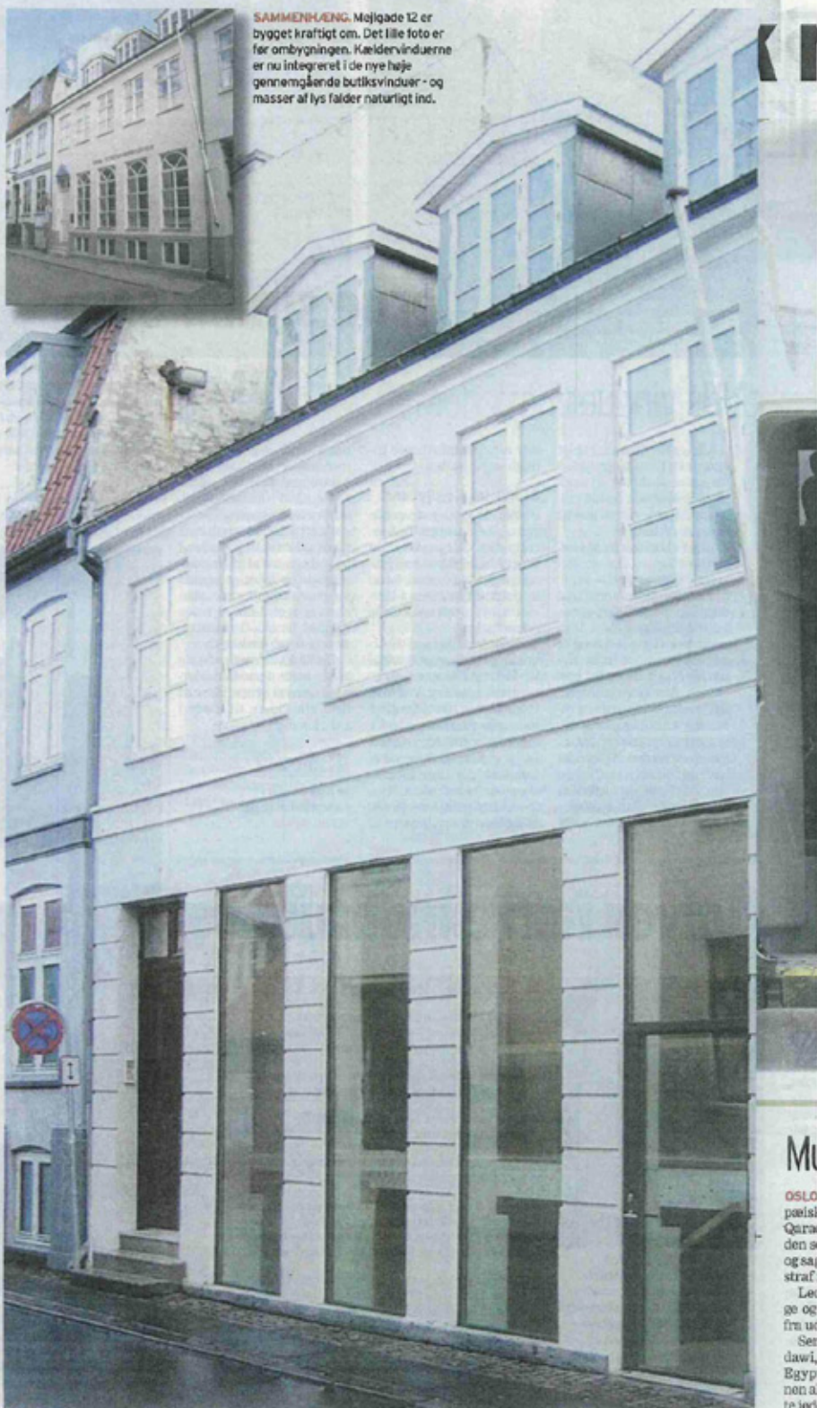
SAMMENHÆNG. Møjløge 12 er bygget kraftigt om. Det lille foto er før ombygningen. Kældervinduerne er nu integreret i de nye høje gennemgående butiksvinduer - og masser af lys falder naturligt ind.

Hvor er den flotteste ejendom i Århus? Giv dit bud på stiften.dk/ejendomme